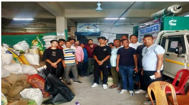
Relief Team distribute goods