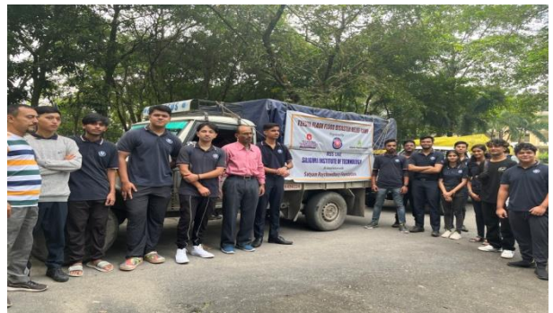
Relief Team ready to start