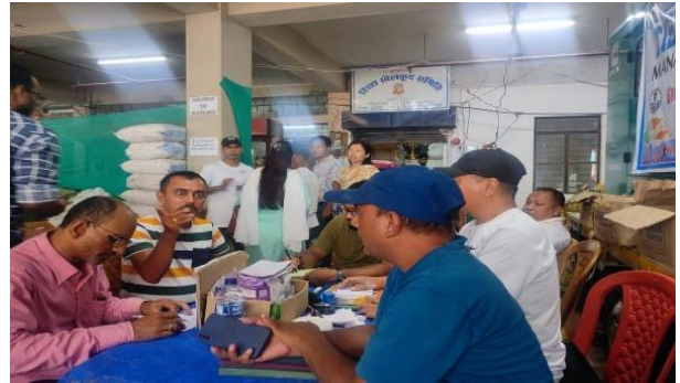
Relief Team provide relief in the camp