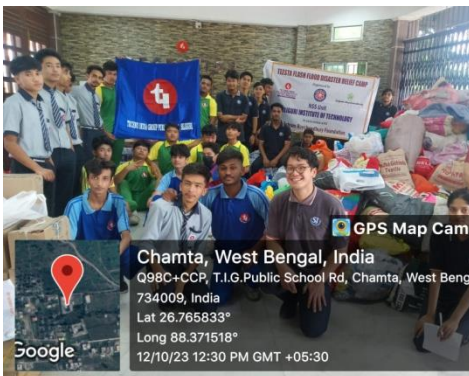
Relief Team packing goods