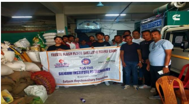
The Relief Team reach the spot