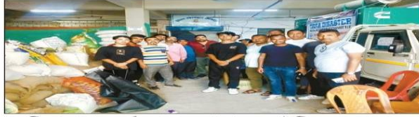
তিস্তা বাজারে দুর্গত মানুষের পাশে এসআইটি-র এনএসএস ইউনিটের সদস্যরা।

লোনাক হ্রদ তেজে হুড়পা বানের জেরে বিপর্যস্ত শিকিম। বাহাত যোগাযোগ ব্যবস্থা। এখনও বিচ্ছিন্ন রয়েছে বহু গ্রাম। যোগাযোগ ব্যবস্থা না থাকায় এখনও বহু গ্রামে ত্রাণ সামগ্রী পৌঁছানো সম্ভব হয়নি। ইতিমধ্যে সরকারি-বেসরকারি বহু সংস্থা সাহায্যের হাত বাড়িয়ে দিয়েছে। অক্টোবর এই সব বিপর্যস্ত মানুষের পক্ষে দাঁড়াল শিলিগুড়ি ইনস্টিটিউট অফ টেকনোলজির (এসআইটি) এনএসএস ইউনিট। সহযোগিতায় সত্ৰম বায় টোল্ডরি ফাউন্ডেশন। এদিন জোব মটা নাপানি নিরিখুড়ির শালবাড়ির কাছে এসআইটি ক্যাম্পাস থেকে ত্রাণ সামগ্রী নিয়ে রওনা হন এসআইটি এবং টেকনো ইন্ডিজ গ্রুপ পাবলিক স্কুলের পড়ুয়া-সহ এসআইটির শিক্ষাকর্মীরা। গজবাইলি শিকিম সংলগ্ন কালিম্পাং জেলার প্রাকৃতিক দুর্যোগে ক্ষতিগ্রস্ত তিস্তা বাজার অঞ্চল। ১০ বছর জাতীয় সড়ক প্রতিবেশে ২৩০০য় ওই পথ বর্তমানে বন্ধ। তাই বিকল্প পথ মেরে তিস্তা বাজারে পৌঁছাতে সময় লেগে যায় ত্রাণ ও খাদ্য। তিস্তা বাজারে স্থানীয় হাই স্কুলে ত্রাণ সামগ্রী বিলির ব্যবস্থা করা হয়। এদিন চাল, তেল, মুন, আটা, ময়দা, চিড়া, মুড়ি, পানীয়